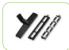
Bodendüse Trocken 3.8025.SPPV33288